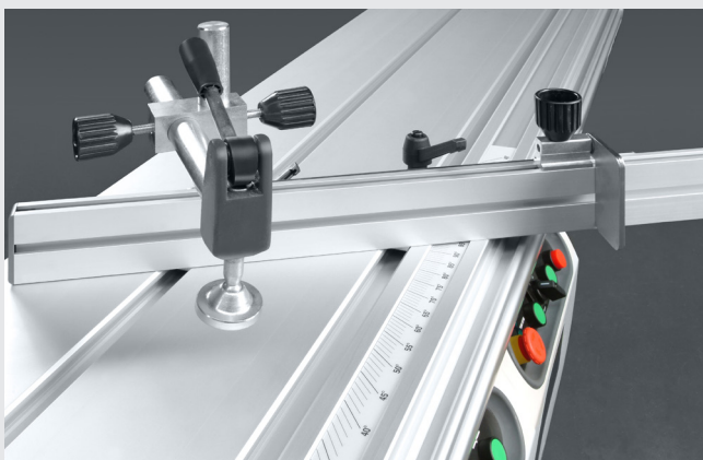
Table à béquille, disponible en option: 1420 x 650 mm 2 incluant règle à tronçonner avec deux butées réversibles.

Complete with mitre fence with eccentric clamp.